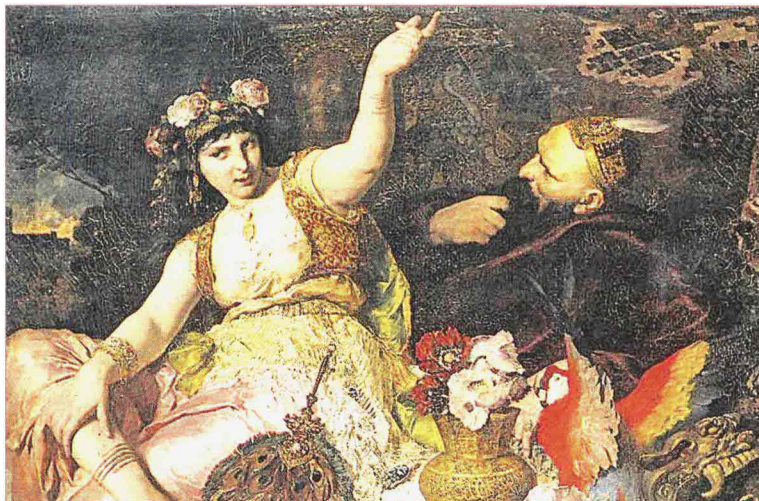
“Sheherazade racconta le sue storie al re persiano Shahriyar” dipinto di Ferdinand Koller (1880). A destra, un’edizione a fumetti delle “Mille e una notte”